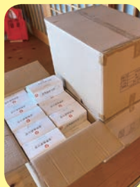
ヘイコーパック様