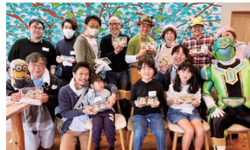
巻きずしでできた！お父さんの料理教室より