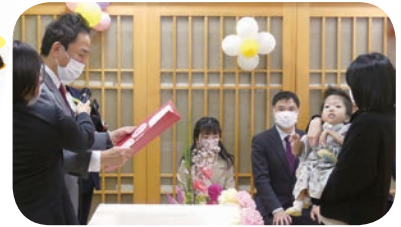
どきどきの卒園証書授与

令和5年3月20日ほかほかの春の陽気の中、はりゆん卒園式が行われました。令和4年度の卒園生は6名! (お一人は体調不良のため別日に行いました)。それぞれかっこよくスーツや袴を着こなしたり、かわいいドレスを着たりして参加されました。