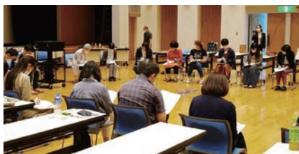
10/2(日) 小児在宅医療実務研修会① 対面での研修会受講の様子

小児在宅医療体制構築事業の充実を図るための検討会でも、令和5年度以降は対面での研修会の開催が検討されています。