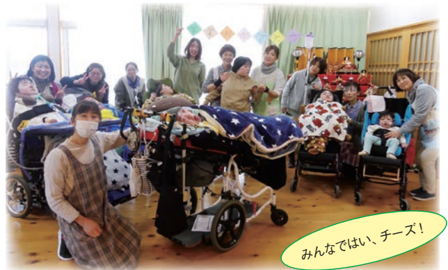
みんなではい、チーズ!