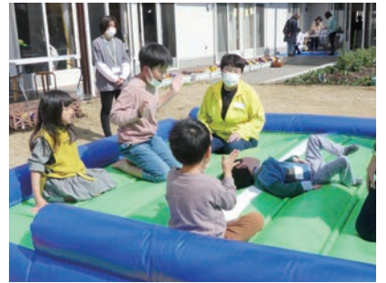
▲エアトランポリンにみんな大はしゃぎ！

屋 外では、エアトランポリンを設置しその中で子どもたちが鬼ごっこをするなどして楽しみ、不思議な体験ができる科学実験にはしゃぐ声がいっぱいでした。さらに正義の味方精霊法士トチノキッドとの写真撮影会も行われ、沢山のご家族が一緒に写真を撮られていました。お菓子すくいコーナーも大人気でした。