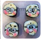
▲かわいい巻きずしの完成です！