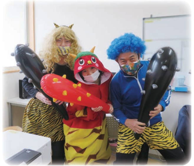
鬼は〜外!! (節分の様子)

節 分では、とっても優しい鬼さんが、皆の厄を一緒に落とすため、うりずんに乗り込んできました！！ 今年は、クラッカーのような武器に（丸めた紙でできた）お豆を準備。鬼さんに向けて発射！とみんなで節分を楽しみました。