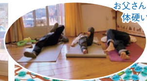
お父さん、 体硬いかも(笑)

たちが一緒にキャラクター 巻きずしを作りました。準備と指導のお蔭で、素敵な巻きずしが仕上がりました。次回も楽しみですね。