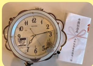
令和4年度卒園生より寄贈品

多くの方々から寄贈品をいただきました。誌面の都合により、すべての寄贈品を掲載できず、申し訳ございません。心より御礼申し上げます。