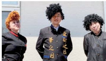
うりずん応援団 ひさが長い〜学ラン応援団です

初の応援団長！をさせていただきましたが、長ランに金色に光るハレの日、ケの日の文字は特別な日も、日々の日常も楽しく大切に過ごしてほしいというスタッフからのメッセージでした。小学校でもたくさんの経験ができますように！