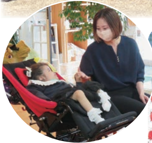
全員卒園! いい笑顔でした♪