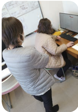
打ち合わせの様子

これからも、その方それぞれ楽しみ方に工夫を凝らし、うりずんスタッフも一緒になって楽しんでいきたいと思ひます。