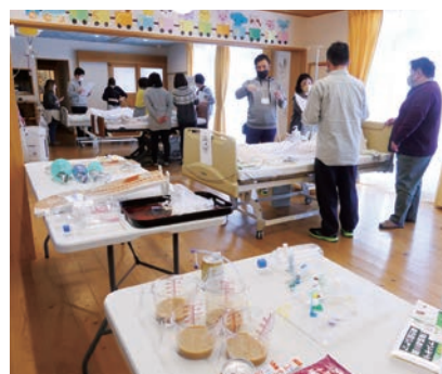
第3号研修実技の様子