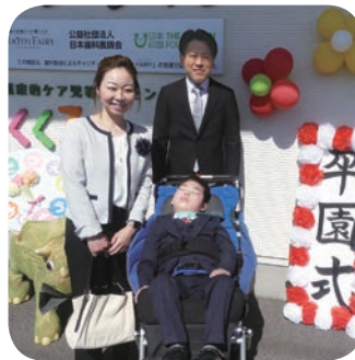
かっこいい服を着て…